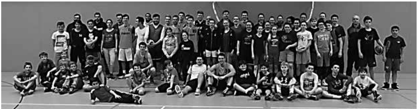
Die aktiven Teilnehmer beim Weihnachtsturnier

Kurz vor Weihnachten hatten die Basketballer der SG Weiterstadt viele Gründe zum Feiern. Am 22. Dezember hatte die Abteilung zum Abschluss des Jahres ein internes Späturnier für alle Mitglieder organisiert, um das Jahr gemeinsam in gemütlicher Runde ausklingen zu lassen. Gleichzeitig wollte der Vorstand der im Jahre 1986 gegründete Abteilung das 30-jährige Jubiläum des Weiterstädter Basketballs mit vielen aktiven Spielern und ihren Eltern sowie Freunden und Helfern zelebrieren. Zu diesem Zweck hatten die Spieler der 1. Herrenmannschaft alles organisiert und für ein Spielprogramm, Musik und reichliche Verpflegung gesorgt. Die aktiven Teilnehmer wurden in bunt gemischten Mannschaften sortiert, in denen auch die Kleinsten die Chance erhalten sollten, mit groß gewachsenen Kollegen oder mitmachenden Eltern und Freizeitspielern, sogar mit Mitgliedern der Seniorenteams, auf dem Feld zu stehen. Insgesamt machten etwa 80 Spieler in den verschiedenen Teams mit, und diese