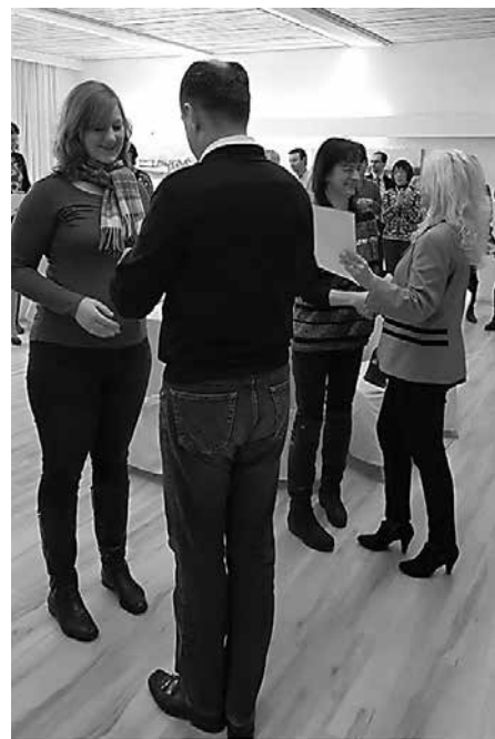
Urkundenüberreichung für das Tanzsportabzeichen 2016

Anfänger und Wiedereinsteiger im Standard und Latein-Tanzen haben die Möglichkeit, ab Freitag, den 03.03.17 von 20-21 Uhr wöchentlich ebenfalls im