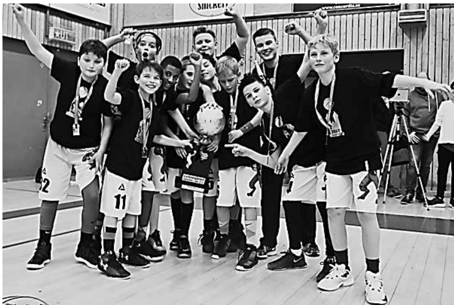
Das Weiterstädter mU12-Team mit Pokal in Lund

Die Stadt Lund im Südwesten Schwedens veranstaltet jedes Jahr im Januar für ca. 4000 Basketballer die weit bekannten Lundaspelen, die zu den größten Jugendturnieren in Europa zählen und in diesem Jahr mit 14 teilnehmenden Ländern wieder sehr gut besetzt waren. Zum ersten Mal fanden auch die Weiterstädter Jungkängurus der mU12-Mannschaft den Weg in die Stadt, um am Wettbewerb teilzunehmen. Wo Weiterstadt liegt, wusste zunächst in Lund keiner, als die SGW-Jungs jedoch die Stadt verließen, machten sie sich nicht nur auf der Weltkarte bemerkbar sondern trugen sich sogar noch in die Geschichtsbücher der Lundaspelen ein.