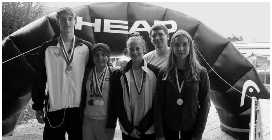
12 Medaillen bei Hessischen Jahrgangsmeisterschaften/ Baunatal

Im Dezember wurde leider wieder das Weiterstädter Hallenbad für einige Wochen geschlossen und die Trainingseinheiten mussten –soweit möglich– in andere Bäder in der Umgebung verlegt werden. Alle waren froh, als sie im Janu-