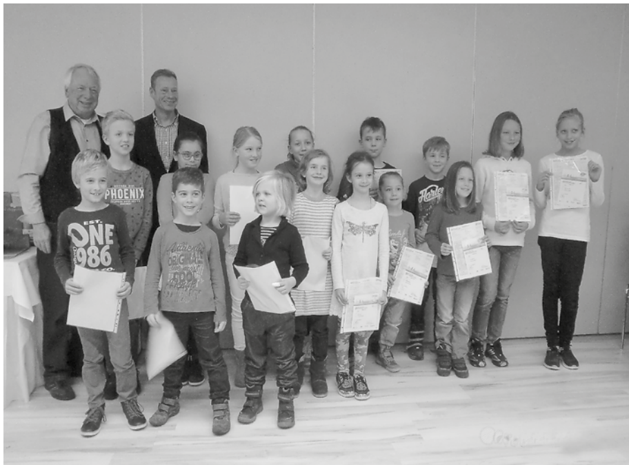
Die jüngsten Erwerber des Sportabzeichens