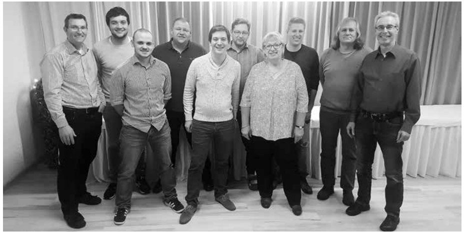
Der komplette Vorstand vom TTV