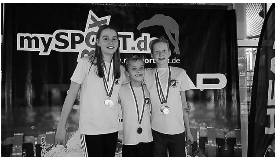
Medaillengewinner der SGW bei den hessischen Jahrgangsmeisterschaften in Wiesbaden

Am vergangenen Wochenende fuhren 11 Schwimmerinnen und Schwimmer der 1. und 2. Wettkampfmannschaft nach Wiesbaden zu den hessischen Jahrgangsmeisterschaften auf der Kurzbahn für die jüngeren Jahrgänge (2004-2006 weiblich und 2002-2006 männlich). Der Saisonhöhepunkt verlief äußerst erfolgreich für die SGW, denn die 11 Schwimmer gewannen bei ihren 54 Starts 10 Medaillen (1x Gold/7x Silber/2x Bronze), erzielten weitere 26 Top-Ten-Platzierungen und schlugen 32mal mit persönlicher Bestzeit an. Obwohl sich Silas Goet (2005) zum wie-